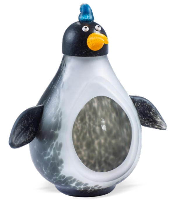
SCHWARZ-WEISS | BLACK-WHITE 15-96