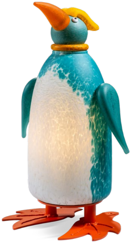
TÜRKIS-WEISS | TURQUOISE-WHITE 32-24