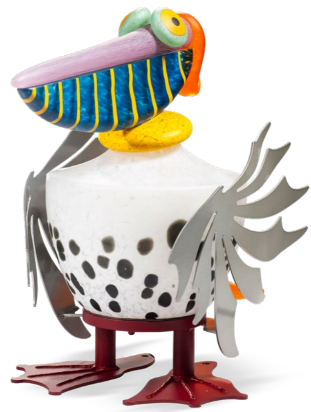
WEISS | WHITE 32-26