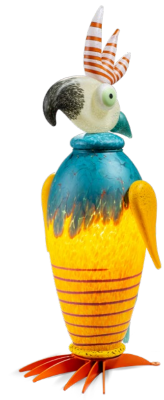
TÜRKIS-GELB | TURQUOISE-YELLOW 31-97