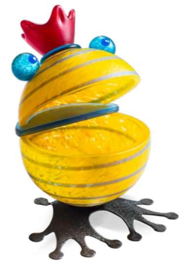
ZITRO | LIME GREEN 15-77

SCHALE | BOWL ↓ 28 CM | 11" ↔ 20 CM | 8"