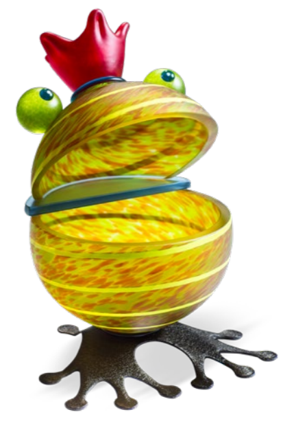
OLIV | OLIVE 15-79