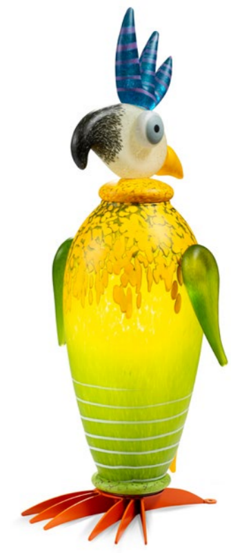
GELB-ZITRO | YELLOW-LIME GREEN 31-98