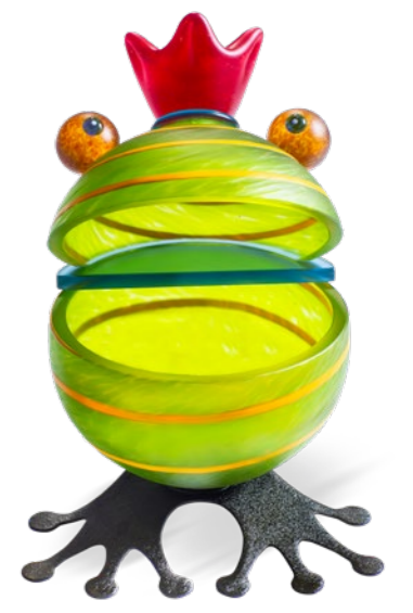
GELB | YELLOW 15-78