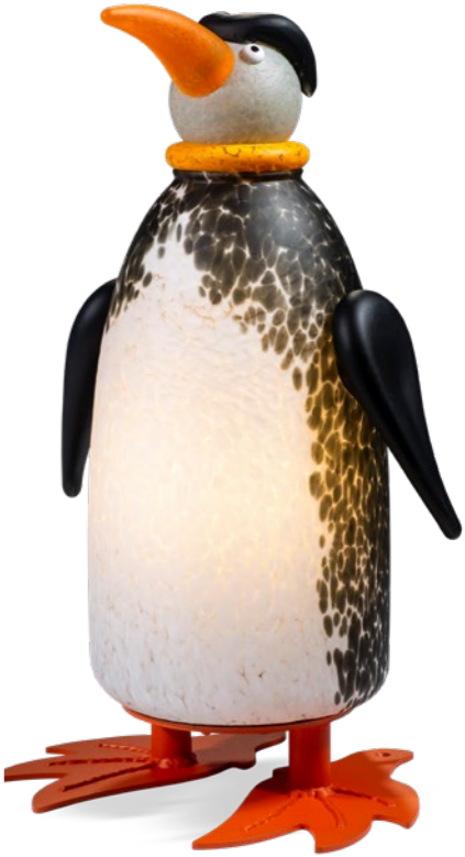
SCHWARZ-WEISS | BLACK-WHITE 32-23