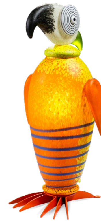
ORANGE-ZITRO | ORANGE-LIME GREEN 31-94