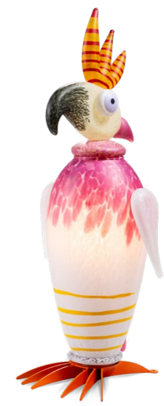
ROSA-WEISS | PINK-WHITE 31-96