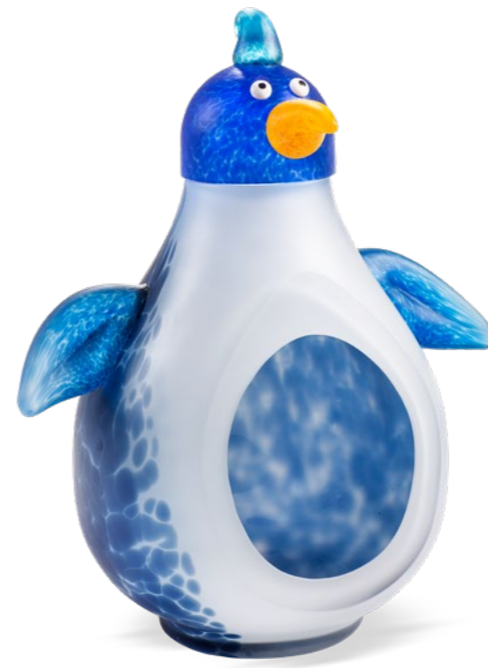
BLAU-WEISS | BLUE-WHITE 15-87

SCHALE | BOWL ↓ 36 CM | 14" ↔ 30 CM | 12"