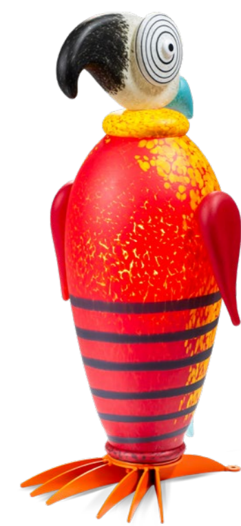
ROT-GELB | RED-YELLOW 31-93