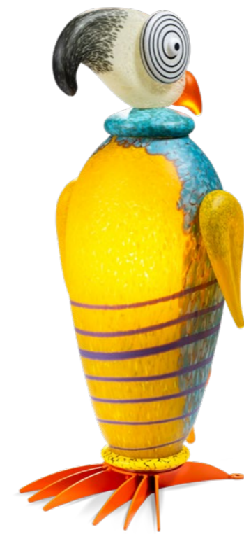
GELB-TÜRKIS | YELLOW-TURQUOISE 31-95