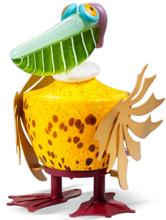
GELB | YELLOW 32-25